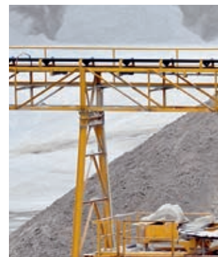
Fotos v.l.n.r.: Coal mine excavator, Carrière d'extraction de sable, kiesgrube, Convoyeur de carrière